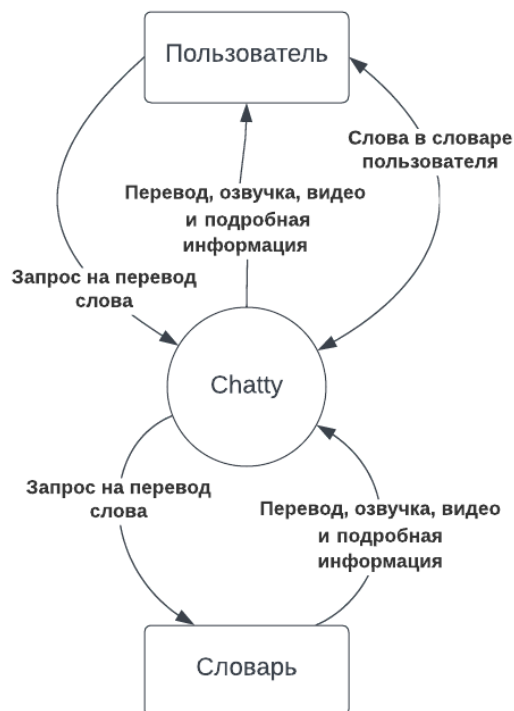
Рисунок 1. Контекстная диаграмма для версии 2.0 веб-приложения Chatty